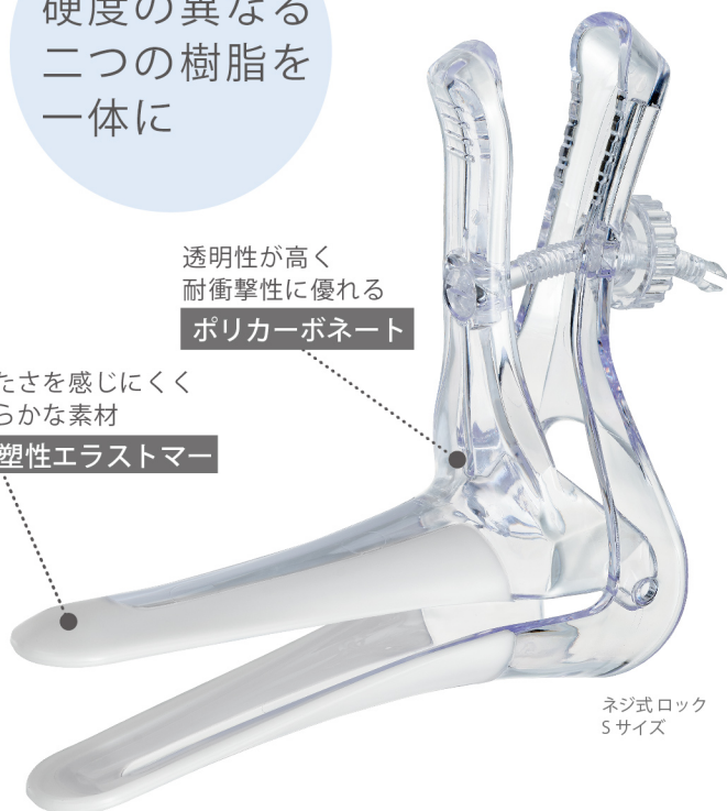
ネジ式ロック Sサイズ